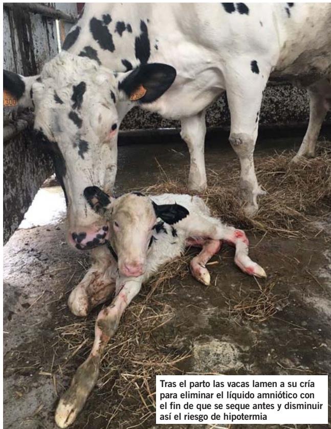
Tras el parto las vacas lamen a su cría para eliminar el líquido amniótico con el fin de que se seque antes y disminuir así el riesgo de hipotermia

Otra opción es mejorar la separación madre-ternero, realizándola de la forma más suave posible. Esto significa separar el ternero de la madre (impedir que pueda mamar de ella), pero permitiendo aún algo de contacto físico entre ellos. Por ejemplo, mover los terneros a un corral cerca de