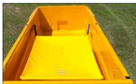
Toldo de recepción de las mercancías (1800 x 2500 mm)