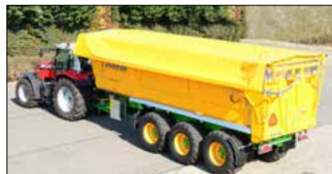
Toldo hidráulico Telecover