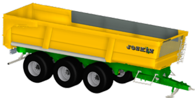
Trans-SPACE 9200 sin realces fijos