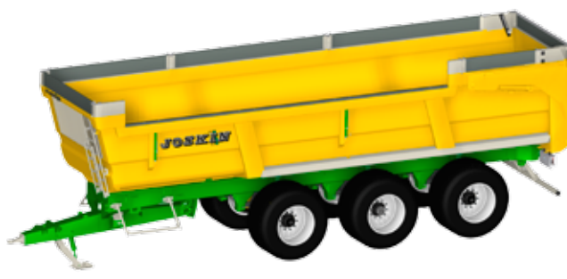
Trans-SPACE 9200 con realces fijos 25 cm

Datos no contractuales, pueden evolucionar.