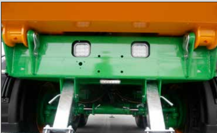
Bisagras de vuelco espaciadas

Gracias a un realce hidráulico de 50 cm en el lado izquierdo y realces fijos (opcionales) de 25 cm en los otros lados, la caja alcanza una altura de 1,75 m y un volumen de 36,2 m 3 . En la versión estándar, el desplazamiento del realce hidráulico está limitado a 25 cm para una altura total de caja de 1,50 m.